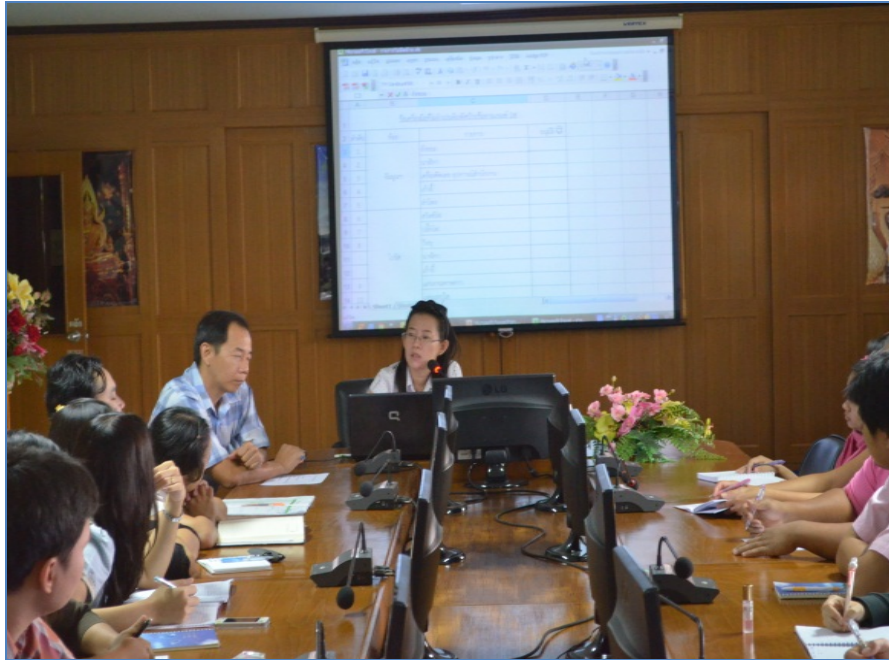
การประชุมคณะกรรมการ ๕๘ ครั้งที่ ๑/๒๕๕๖