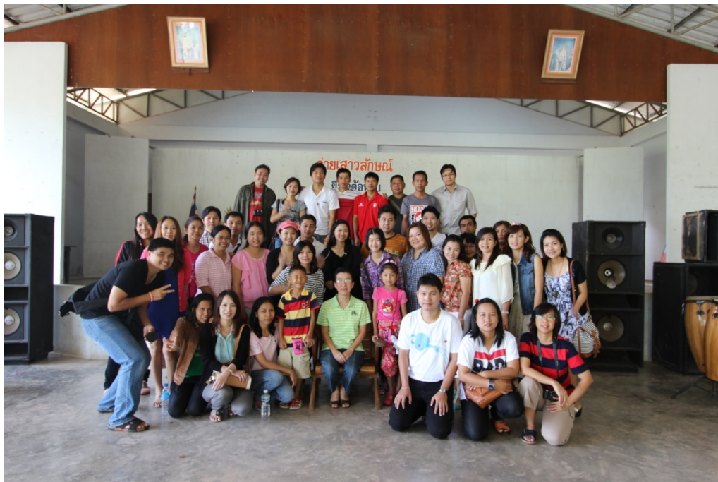
ศึกษาดูงานนอกสถานที่