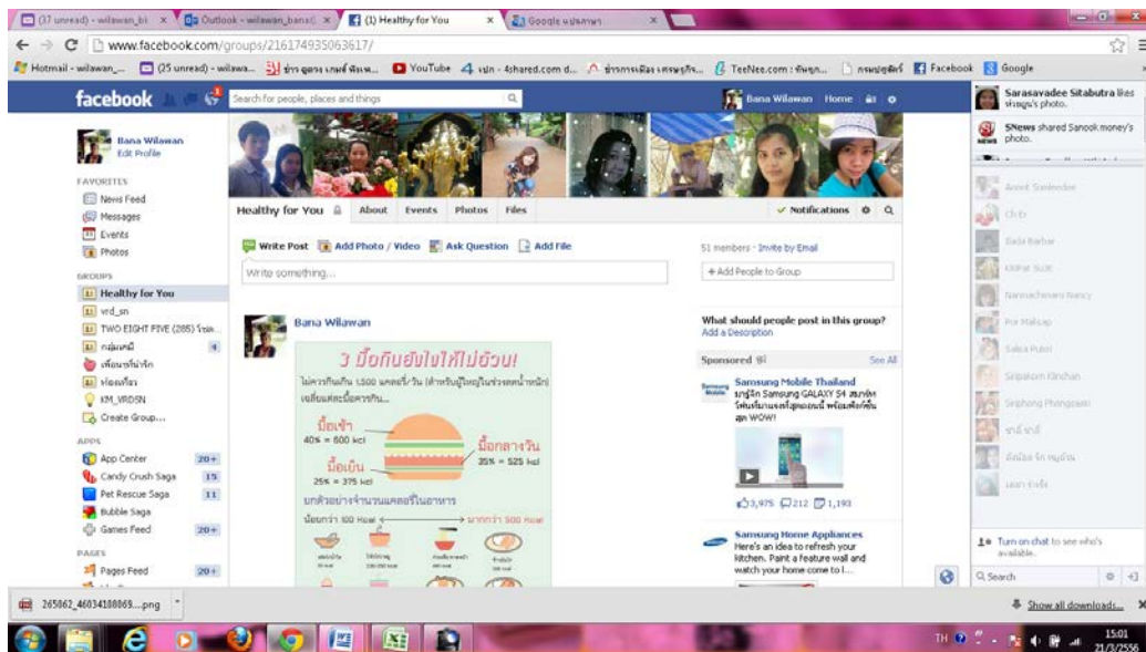
กลุ่ม Healthy for you ใน Facebook เพื่อประชาสัมพันธ์ข่าวสุขภาพ