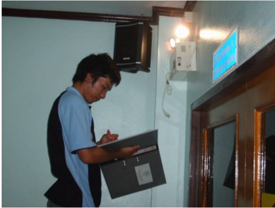
ตรวจสอบความใช้ได้ของเครื่องไฟฟ้าฉุกเฉิน