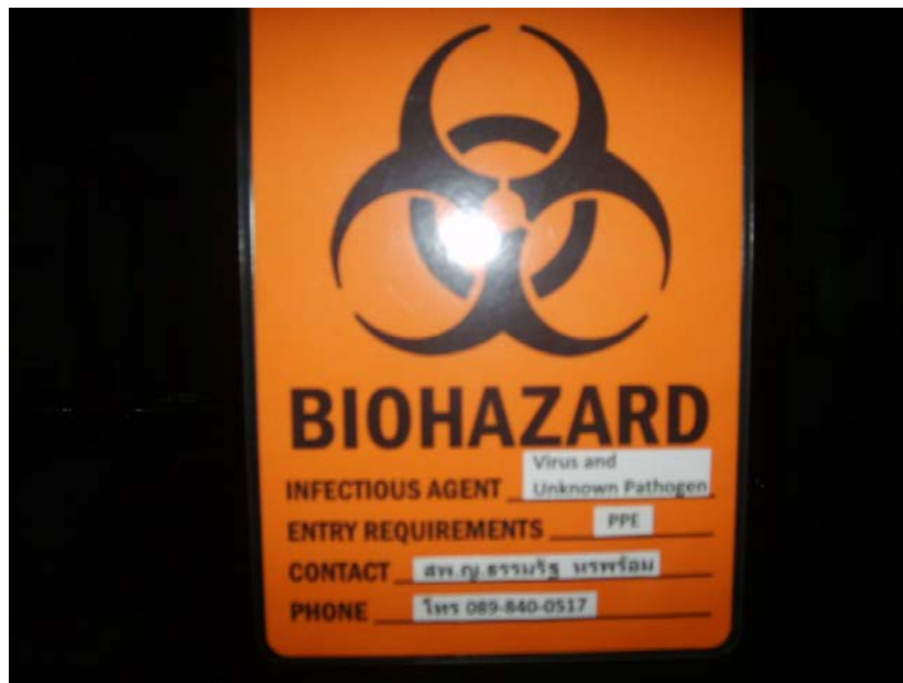
จัดทำป้ายสัญลักษณ์ BIOHAZARD