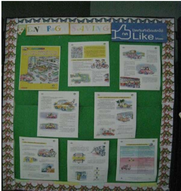
บอร์ดแสดงความรู้เรื่องการประหยัดพลังงาน