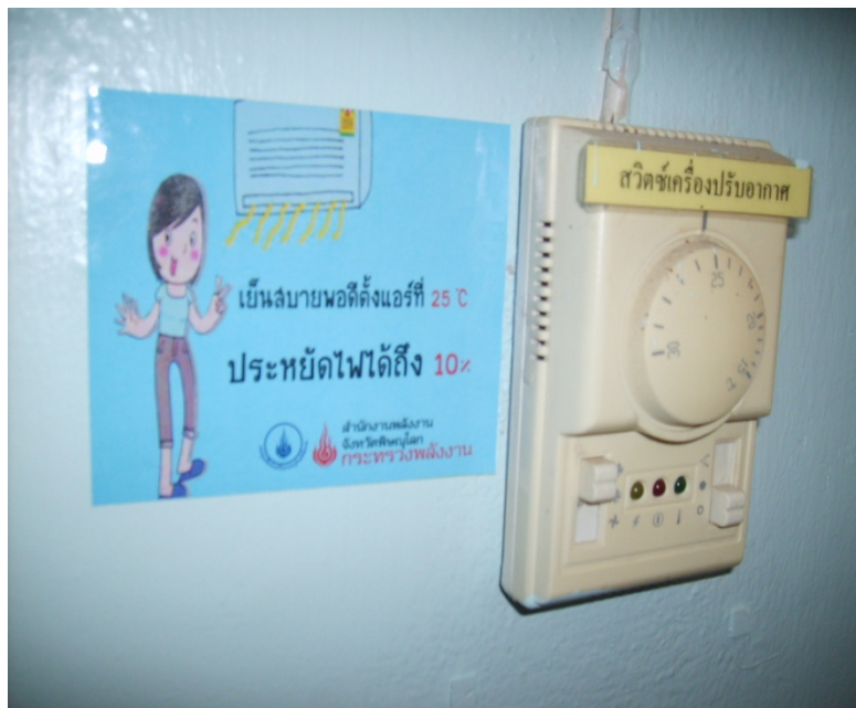
รณรงค์การประหยัดพลังงาน