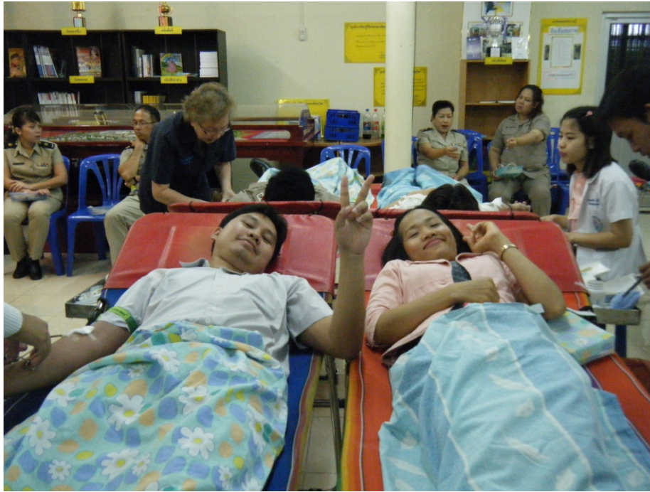
บริจาคโลหิต