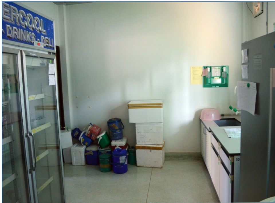
ภาพถ่ายพื้นที่ก่อนทำกิจกรรม ๕