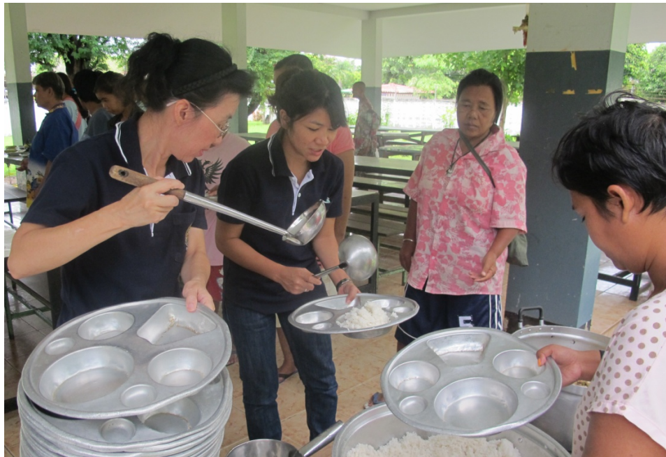
บริจาคสิ่งของและอาหารสถานสงเคราะห์วังทอง