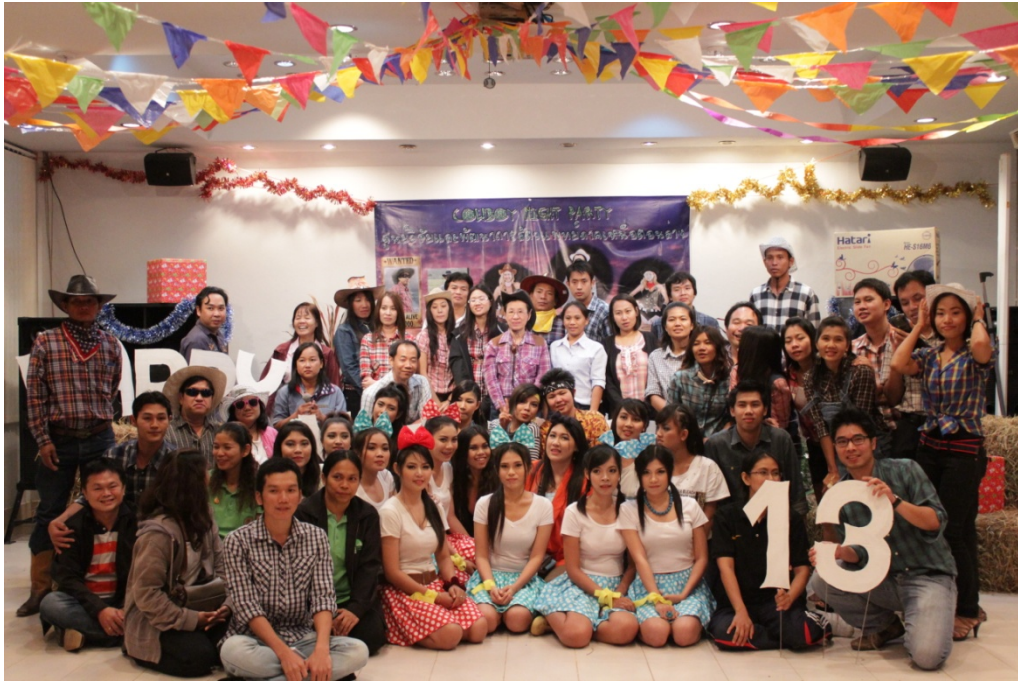
จัดกิจกรรมสังสรรค์เสริมสร้างความสามัคคีในวันส่งท้ายปีเก่าต้อนรับปีใหม่ ๒๕๕๖