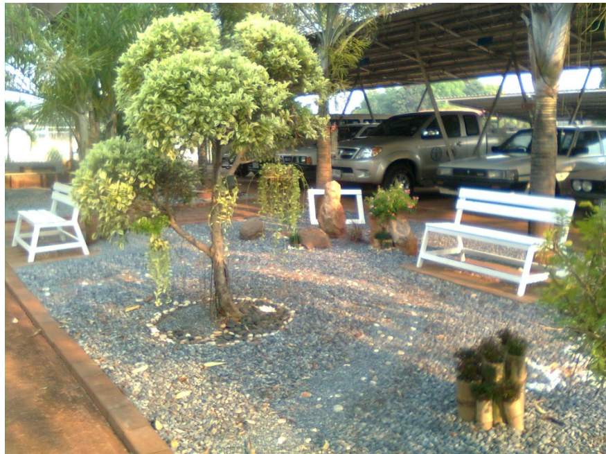
จัดหา ต้นไม้ ไม้ดอกไม้ประดับปลูกเพิ่มเติม