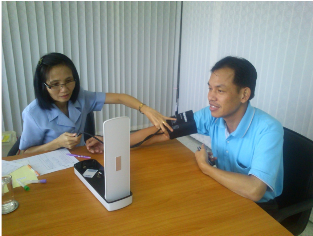
ตรวจสอบคุณภาพประจำปี