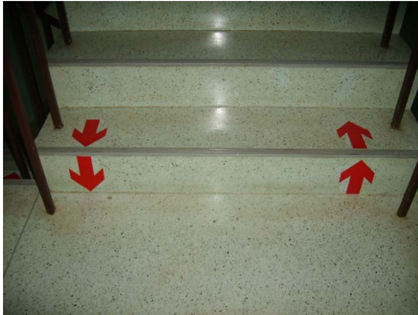
สติ๊กเกอร์ป้ายสัญลักษณ์ ลูกศรบอกทางขึ้นลงบันได