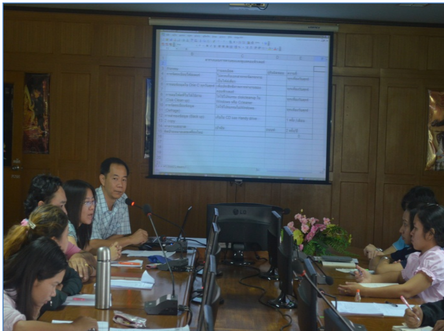
การประชุมคณะกรรมการ ๕๘ ครั้งที่ ๒/๒๕๕๖