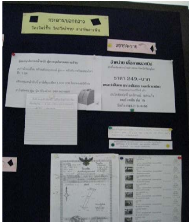
กระดานบอกกล่าว สำหรับการซื้อขายสิ่งของต่างๆ