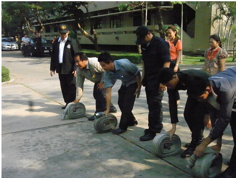
เจ้าหน้าที่ศูนย์ฯ เข้าร่วมฝึกอบรมการดับเพลิงขั้นต้นที่สถาบันสุขภาพสัตว์แห่งชาติ