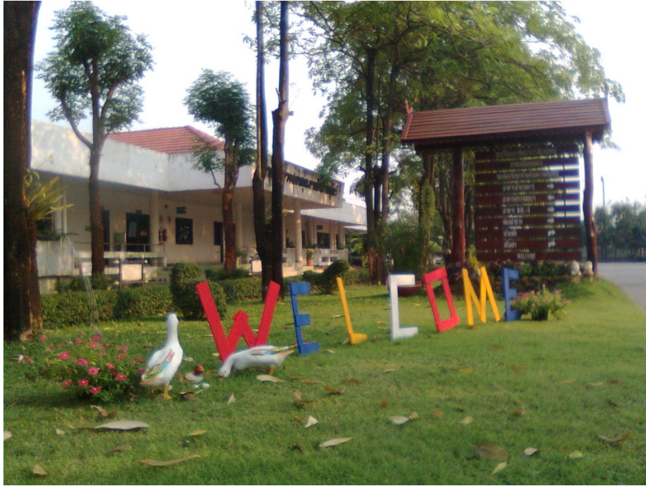
จัดทำป้ายยินดีต้อนรับบริเวณทางเข้าศูนย์ฯ