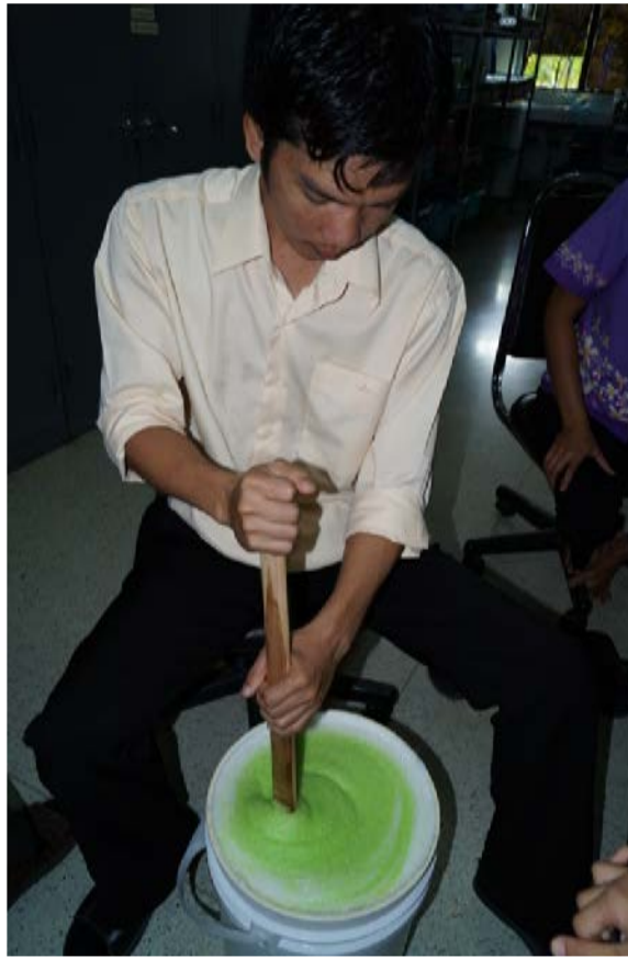
ทำน้ำยาล้างอุปกรณ์สำหรับใช้เองภายในศูนย์ฯ