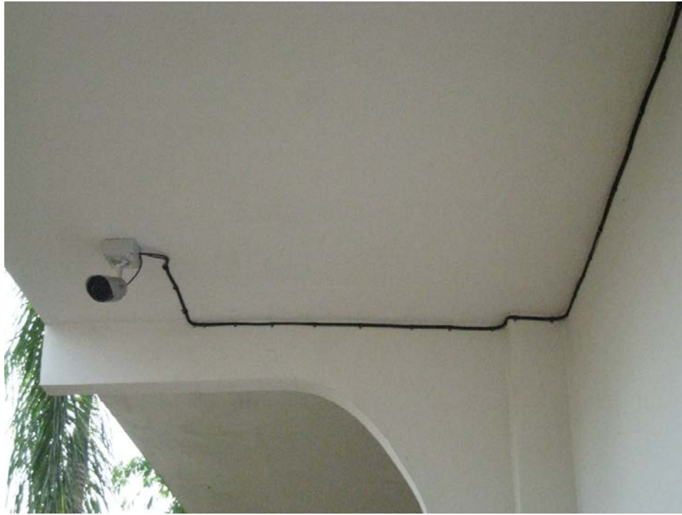
ติดตั้งกล้องวงจรปิดรอบศูนย์