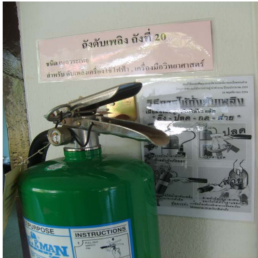
จัดทำวิธีการใช้ถังดับเพลิงอย่างถูกวิธี